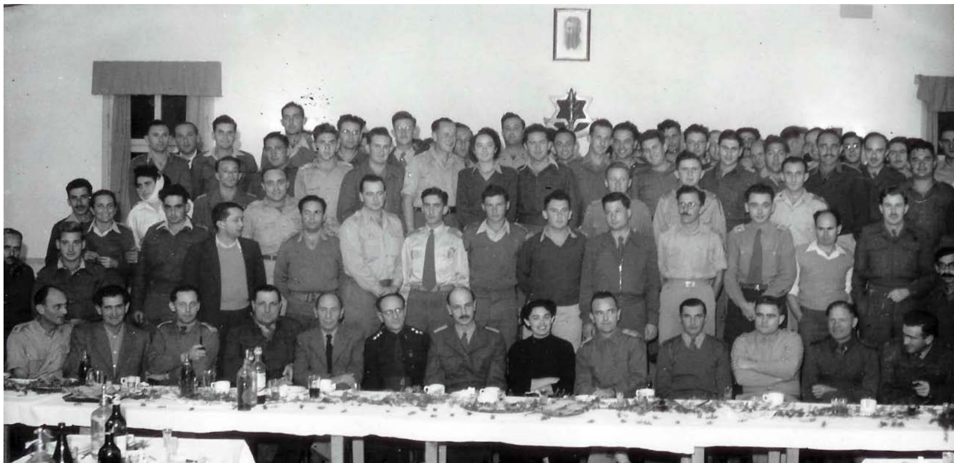
חילופי מפקדי החיל: סא"ל יצחק אלמוג מחליף את סא"ל יעקב ינאי, נובמבר 1949 זיהוי האישים: בעמוד הבא