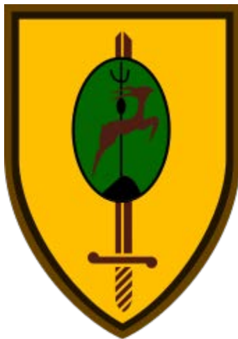
תג הכתף של חטיבת עודד