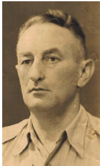
ירחמיאל בלקין מפקדו השני של השירות