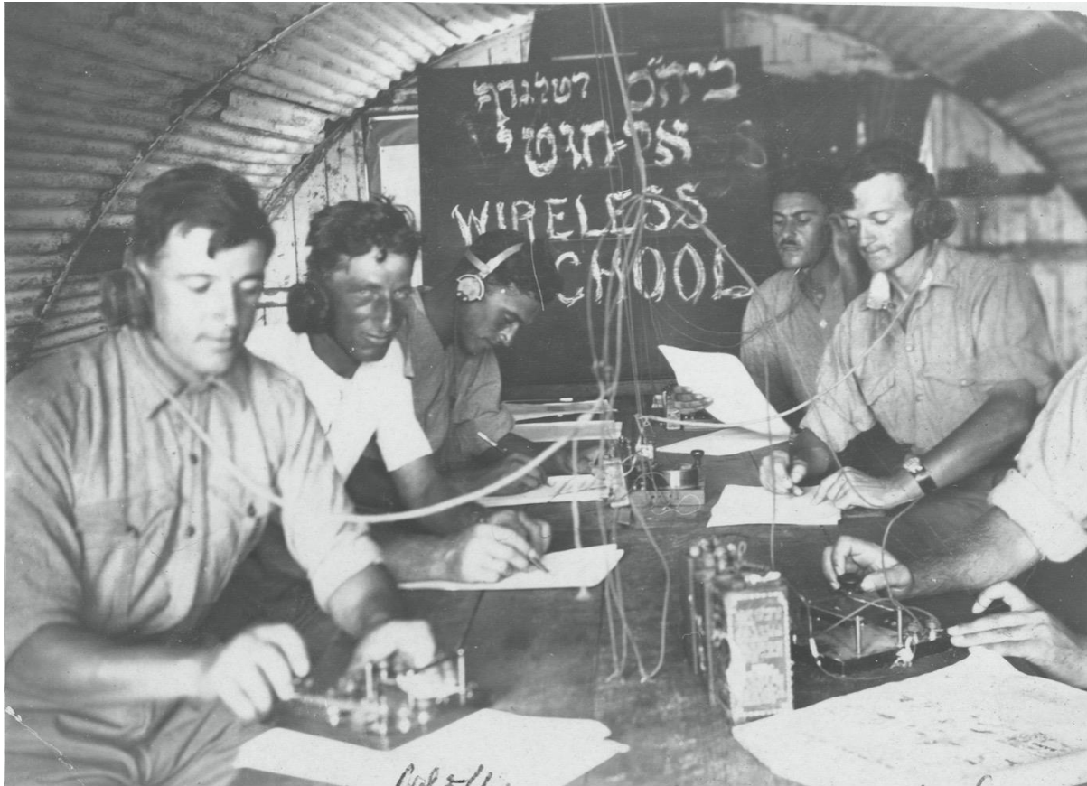
הז'נדרמריה הפלשתינאית, אימון מורס בבית הספר לטלגרף אלחוטי, מחנה סרפנד (צריפין), 1923

במבצע 'אגתה', ב-29 ביוני 1946, שנועד לבלום את המערכה הטורוריסטית היהודית בפלשתינה, סגר הצבא הבריטי את הסוכנות היהודית, עצר את רוב מנהיגיה וחלק מפיקוד 'ההגנה', והחרים טונות של מסמכים. האצ"ל התנקם בפיצוץ המפקדה הבריטית במלון המלך דוד בירושלים ב-22 ביולי 1946. בפיצוץ נהרגו 91 אזרחים ואנשי צבא בריטים. כתגובה ללחץ פרלמנטרי הממשלה פרסמה באוגוסט 1946 'ספר לבן', שכלל מברקים ש-GCHQ ירט ופענח, שהוכיחו את הקשר בין הסוכנות היהודית ל'הגנה' (ואת הקשר של 'ההגנה' לאצ"ל וללח"י). רוב המידע נגזר משמונה דו"חות ISOATS ו-ISTRIA שעברו התאמה במסמך הסופי, כדי לשמור על חיסיון המקורות.