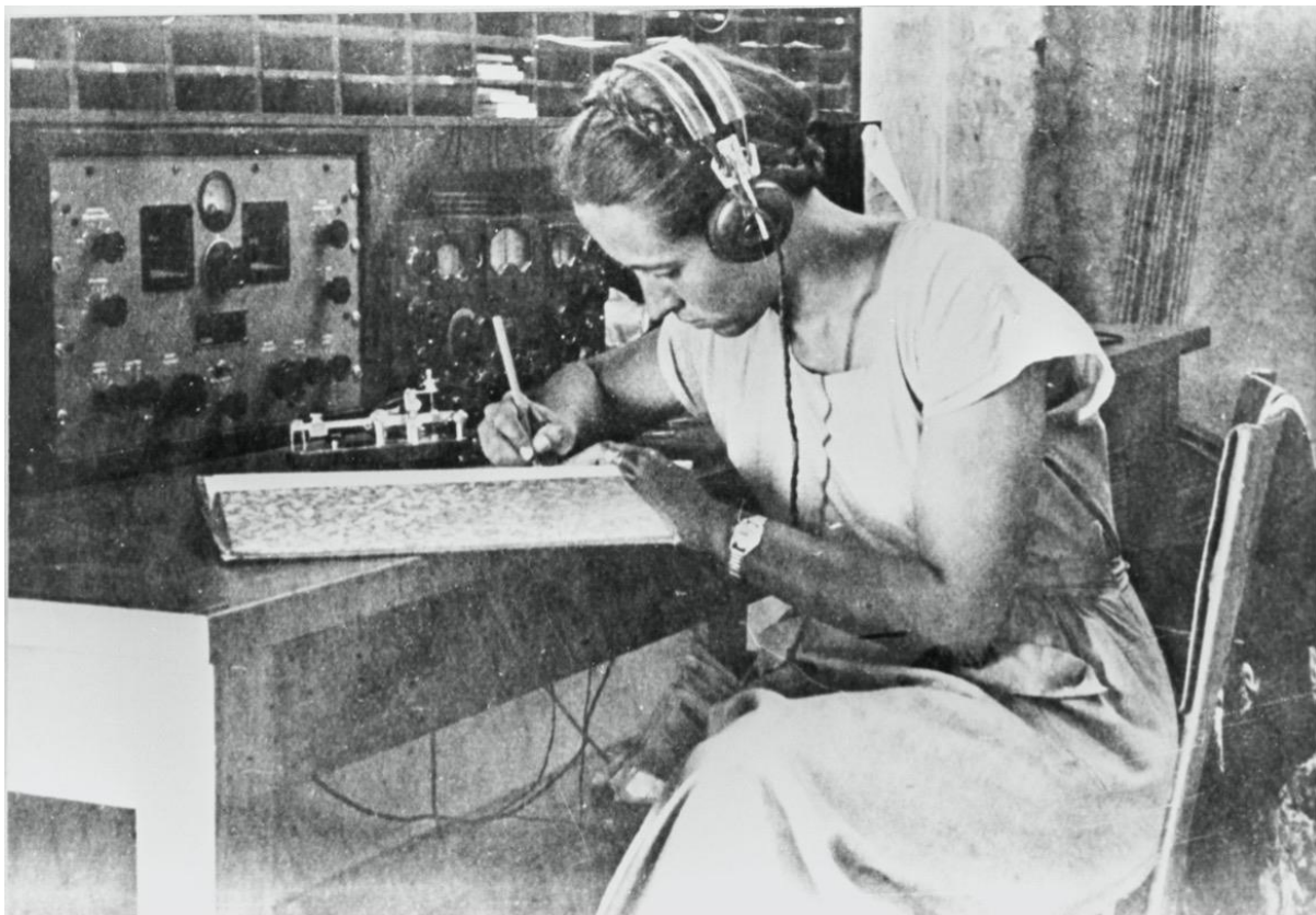
אלחוטאית של 'ההגנה' קולטת ידיעה משודרת באיתות מורס