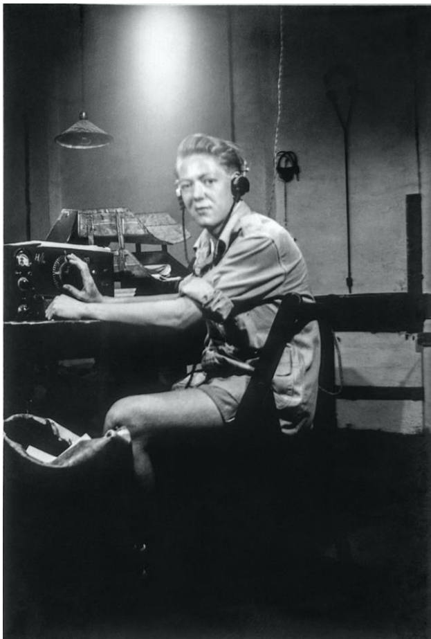
מאזין של MERS במחנה סידי בישר, ליד אלכסנדריה

במהלך מלחמת העולם השנייה, גוף ביטחון פנים, יחידה קטנה של 'שירות בטחון רדיו' (RSS (Radio Security Service), שיעודה היה לאתר שידורים של סוכני אויב וארגונים חתרניים באימפריה הבריטית, שנודעה בשם MERS (Middle East Radio Security), פעלה ממחנה סידי בישר (Sidi Bishr) סמוך לאלכסנדריה והאזינה לרשתות הרדיו של 'ההגנה', הלח"י והאצ"ל. פעילות זו בוצעה במהלך המלחמה ועד 21 ביוני 1946, עת היחידה נסגרה והפעילות הועברה לקפריסין.