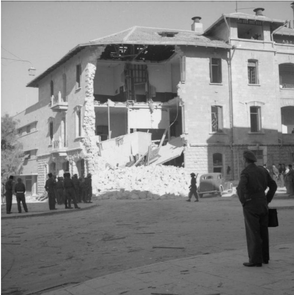
הנזק שגרם פיצוץ טרוריסטי למבנה מטה ה־CID בירושלים, 27 בדצמבר 1945

צוות שאוגד מתוך המדורים הדיפלומטיים והמסחריים של GC&CS שפעל ברחוב ברקלי (Berkeley Street) בלונדון טיפל בחומר שיורט מתעבורת הרדיו של הישוב. ליירוט תעבורה דיפלומטית היה תפקיד חשוב בהבנת מדיניות המדינות הערביות ומדינות אירופה בענייני פלשתינה.