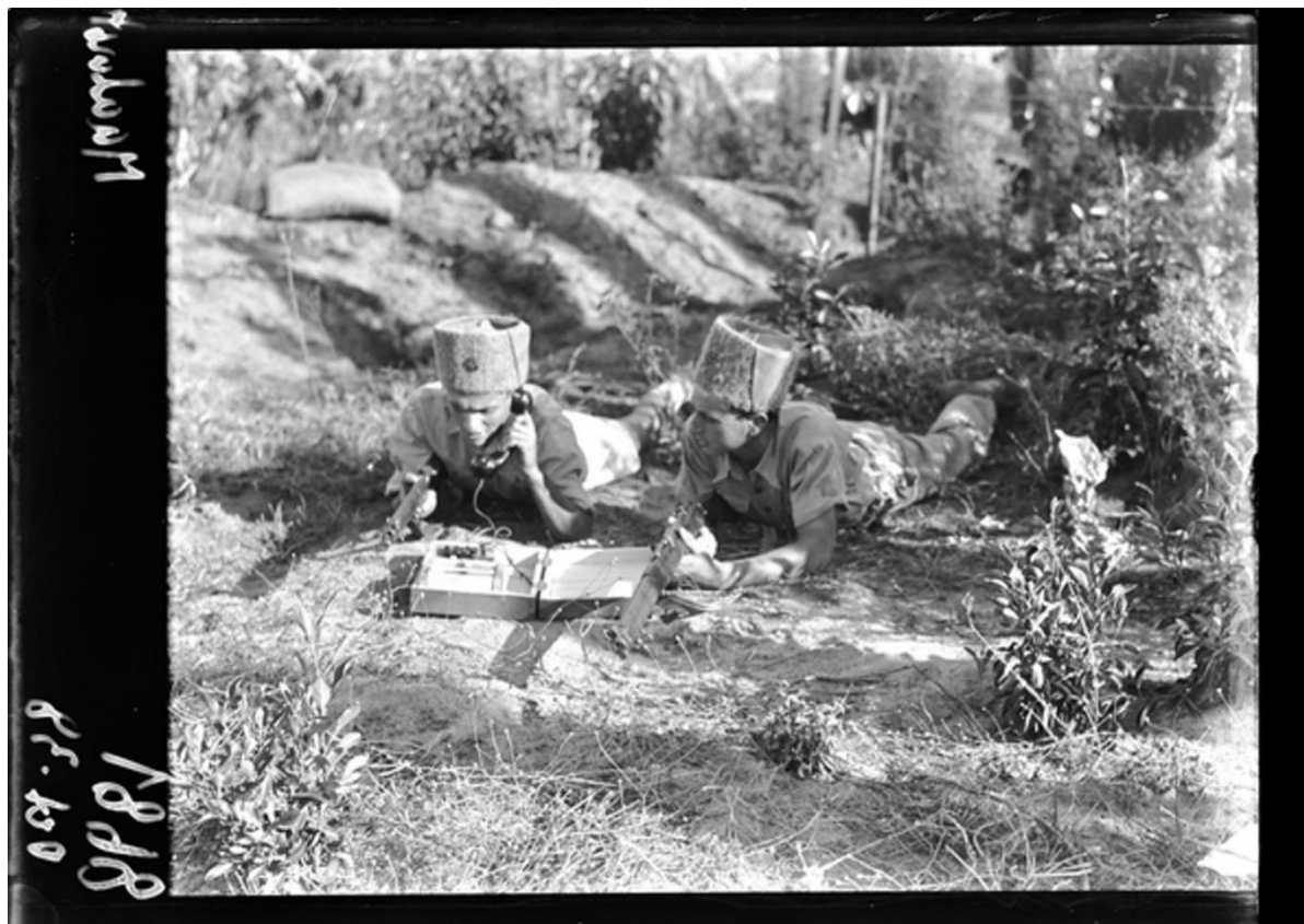
הדרכת נוטרים (משטרת היישובים העבריים) – שימוש בטלפון שדה, קיבוץ מעברות, 1938 צלם: זולטן קלוגר. ארכיון המדינה ISA-Collections-ZKlugerPhotos-000xzva

כהכנות לאפשרות פלישה גרמנית לפלשתינה, בריטניה אימנה את הפלמ"ח (פלוגות המחץ של 'ההגנה') ופיתחה במהלך המלחמה את רשתות מודיעין הרדיו של היישוב. השי"י (שירות הידיעות), זרוע המודיעין של 'ההגנה', שיתף פעולה עם המודיעין הבריטי ועם ה־CID (Criminal Investigation Department), מחלקת החקירות הפליליות של משטרת המנדט. כתוצאה מכך התפתחו היכולות המקצועיות של השי"י ככל שהוא סייע לבריטניה במאבק בנאצים ובאיטלקים, בטרוריסטים יהודים, במורדים ערבים, במרגלים ואפילו בקומוניסטים. מצוידים ביכולות מתקדמות, אנשי מודיעין הרדיו של 'ההגנה' האזינו לרשתות הרדיו של משמר החופים וסייעו להנחות ספינות מעפילים לחופי פלשתינה תוך הפרה של מגבלות העלייה. השירותים היהודים עסקו גם באיסוף ממקורות אנושיים (HUMINT).