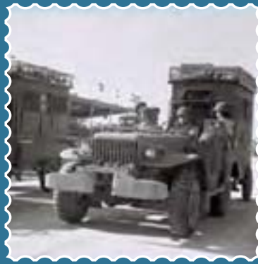
שוכבים ניידיים על גבי רכב במצעד צה"ל, 1948