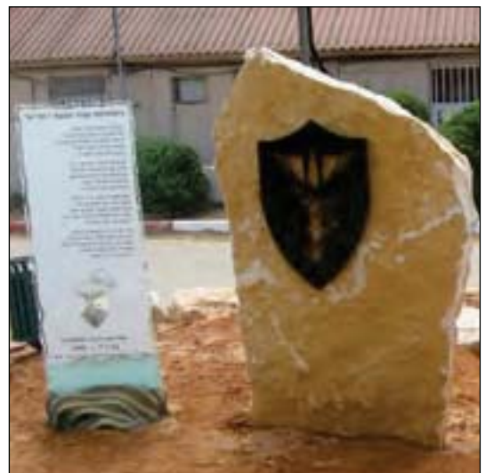
האנדרטה ל"יונה האלמונית" שהוקמה מחדש עם השיר "היונגרמה עבור תעבור"

ובאופן אישי: בשנים האחרונות נעשו ניסיונות לשחזר את האנדרטה, אך הם לא צלחו. בתחילת שנת 2012, במסגרת טקס השקת ערכת מורשת על בה"ד 7 שנערך בעמותה להנצחת חללי חיל הקשר והתקשוב, סיפרתי, בין היתר, על נפלאות השימוש ביוני דואר וגם קראתי שיר שחיברתי במיוחד לרגל האירוע, המבטא את רוח התקופה. פניתי למפקד הבסיס, אל"ם מיקי בוסקילה, ואמרתי