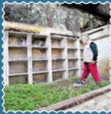
השוכב הנייח בגבעת ברנר