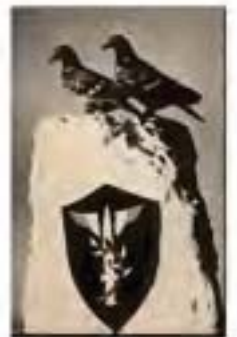
אנדרטה ליונה האלמונית בה"ד 7, 1956

נוח היה, כנראה, הראשון שהפעיל את היונה כאמצעי קשר, כדי לקבל מידע על המבול. מאז, המשיכה היונה לאורך ההיסטוריה לשמש כאמצעי להעברת מידע, החל בימי קדם, עבור בימי הביניים, בעת החדשה ועד תחילת שנות החמישים של המאה העשרים.