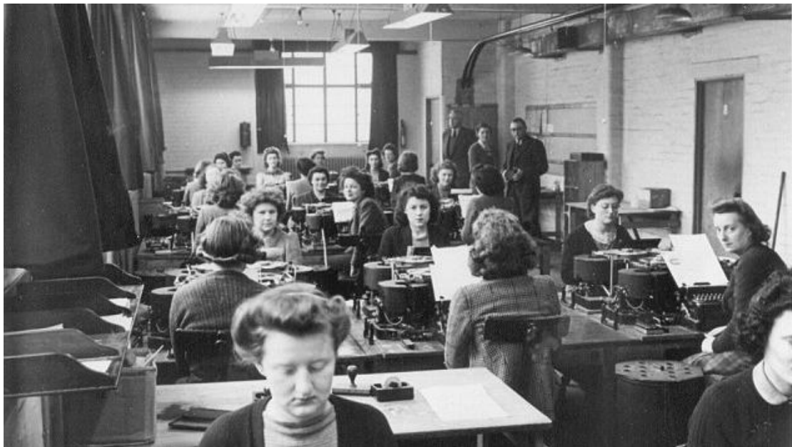
טיפול בתעבורת אניגמה במלחמת העולם השנייה

פחות ידועה תרומת חלק מסגל זה בהקמת מדינת ישראל. זו העת לזכור ולשבח את סיפורם, ולהזכיר לעצמנו את הערכים המשותפים והקו הרציף המחבר בין אישים אלה לבין עבודתנו היום.